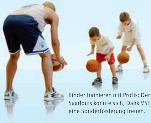
Kinder trainieren mit Profis: Der TV 1872 Saarlouis konnte sich, Dank VSE, über eine Sonderförderung freuen.

Das RWE COMPANIUS Web ermöglicht Ihnen den Erfahrungsaustausch untereinander, unterstützt Sie bei der Selbstorganisation Ihrer Projekte, ist eine Plattform zur Vorstellung der Projekte und macht aus vielen einzelnen Mitgliedern eine große Gemeinschaft.