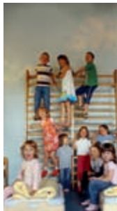
Luftige Wölkchen laden nun im hellen und freundlichen Schlafsaal zum Träumen ein.