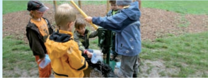
Das Montessori Kinderhaus in Cottbus freut sich Dank der enviaM über die neue Wassermatschanlage, die das naturnahe Spielen unterstützt.