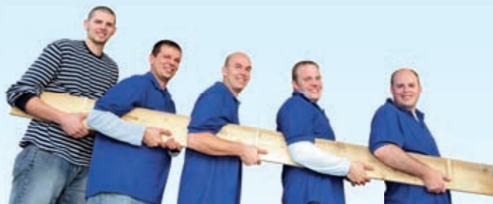
Gemeinsam stark: Die RWE Supply & Trading bei der Neugestaltung der Außenanlagen des Vincenzheims.

Die RWE TSO Strom organisierte eine „Eiszeitwoche“ und bietet diese Ausstellung Schulen als Lernort an.