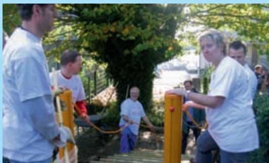
Die RWE Rhein-Ruhr verhalf den Kindern des Kindergartens St. Marien in Essen zu zwei neuen Wippen und einem Klettergerüst.

Für Projektvorschläge, die von außerhalb eingereicht werden, suchen wir im Unternehmen Mitarbeiter, die bei diesen Aktionen als Paten zur Verfügung stehen. So können Sie durch Ihre Mithilfe das gemeinsame Engagement auf eine noch breitere Basis stellen.