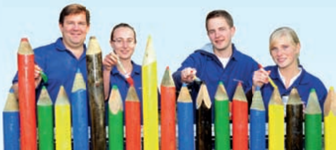
Mitarbeiter der RWE Supply & Trading aus Deutschland und Großbritannien bekennen Farbe für das Vincenzheim in Dortmund.