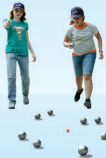
Mitarbeiter der RWE Westfalen-Weser-Ems und der RWE Rhein-Ruhr organisierten ein Bouleturnier für behinderte und nichtbehinderte Kinder.